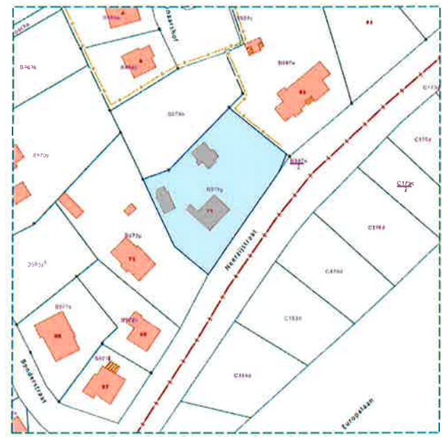
Uitgreksel uit het digitaal kadasterplan (Niet op schaal)