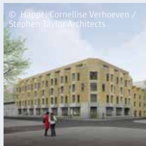
© Happel, Cornillisse Verhoeven / Stephen Taylor Architects